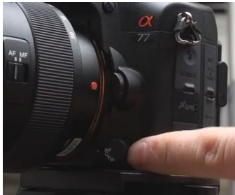
Auf „M“ = manuell Fokussieren stellen

Das Drehrad oben auf der Kamera auf den Filmstreifen (Film) stellen.