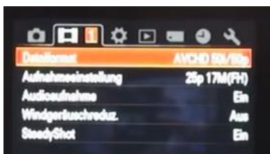
Das Dateiformat „AVCHD“ stellen