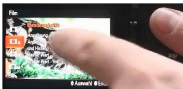
Mit dem Wippschalter den A-Modus wählen