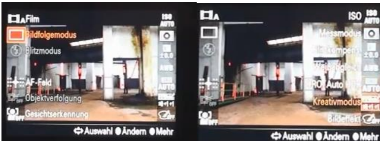
Bildfolgemodus | Kreativmodus