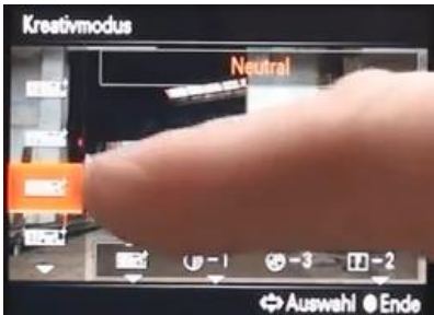
Dort „Neutral“ einstellen.